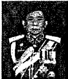
พลเอก จิระ โกมุทพงศ์ สมาชิกสภาปฏิรูปแห่งชาติ และอดีตเจ้ากรมพระธรรมนูญ