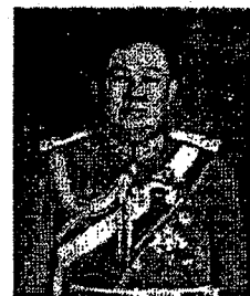
พลอากาศเอก อติเรก จำรัสสุทธิรงค์ อดีตตุลาการศาลทหารกรุงเทพ และอดีตกรรมการตุลาการศาลยุติธรรมผู้ทรงคุณวุฒิ