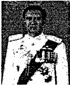
พลตำรวจเอก วันชัย ศรีนวนนัต อดีตผู้ช่วยผู้บัญชาการตำรวจแห่งชาติ และอดีตที่ปรึกษา (สบ ๑๐) สำนักงานตำรวจแห่งชาติ