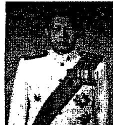
นายปรีดี จุลเจิม อดีตอธิบดีอัยการ สำนักงานอัยการแพ่งกรุงเทพใต้ และอดีตอัยการอาวุโส