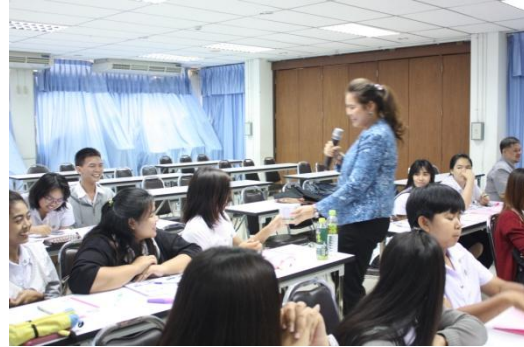
วิทยากรจากหน่วยงานเอกชนบรรยายในช่วงบ่าย