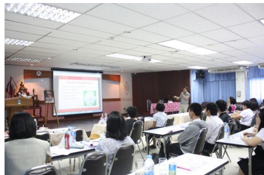
บรรยายภาคีในการอบรมช่วงเช้า