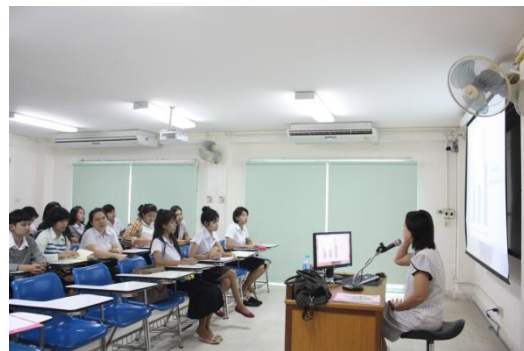
อาจารย์ให้ความรู้เกี่ยวกับงานบริการวิชาการแก่นักศึกษา