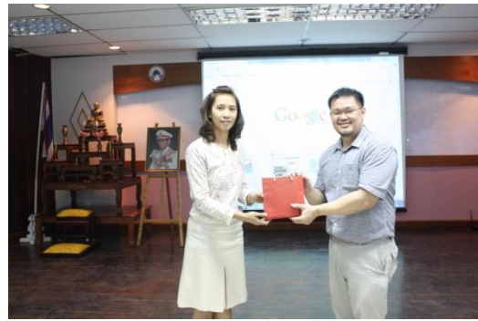
อาจารย์มอบของที่ระลึกแก่วิทยากรที่บรรยายในช่วงเช้า