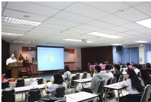
ท่านคณบดีให้เกียรติในการกล่าวเปิดโครงการอบรม