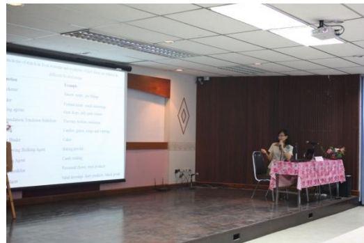
วิทยากรเริ่มการบรรยาย