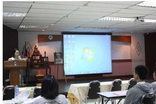
ประธานโครงการกล่าวเปิดการอบรม