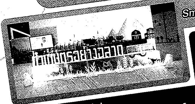
Smart Farming "เกษตรอัจฉริยะ"