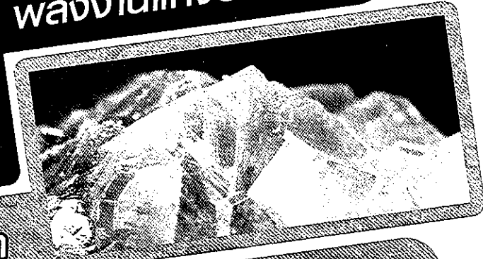
มหัศจรรย์แห่งฟลัก