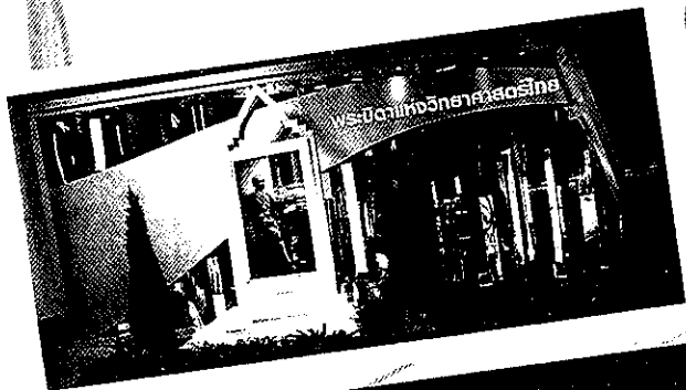
นิทรรศการเกิดพระทีปังกร พระบิดาแห่งวิทยาศาสตร์ไทย