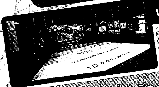
พลังงานแห่งอนาคต